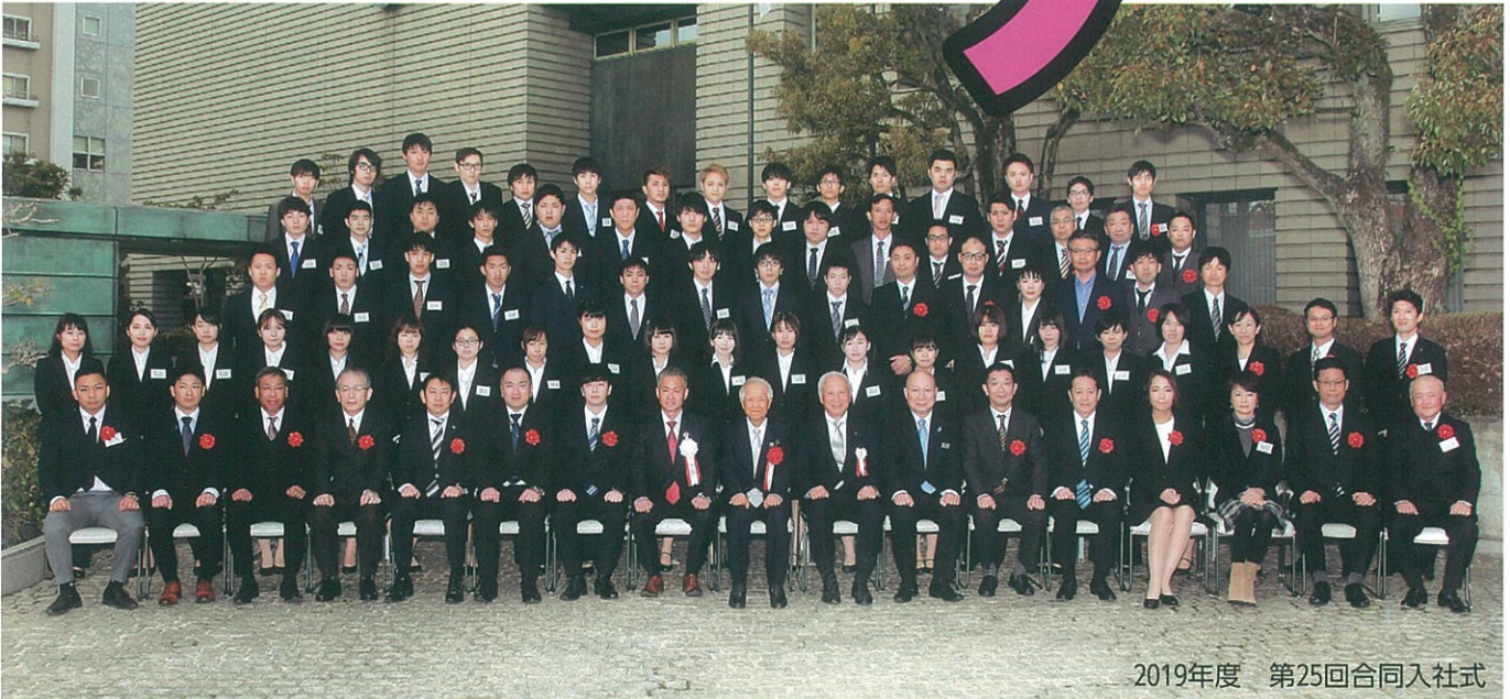
2019年度 第25回合同入社式

URL : http://www.h-keikyo.gr.jp E-mail : keikyo@h-keikyo.gr.jp