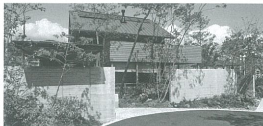
はりまの杜 住宅展示場

そんなヤマヒロの住宅をいつでもご覧いただけるモデルハウス（はりまの杜 しろう杉の家）が砥堀（姫路）と神戸新聞ハウジングセンター姫路会場内（姫路・五軒邸）にあります。皆様、お気軽にご来場下さい。